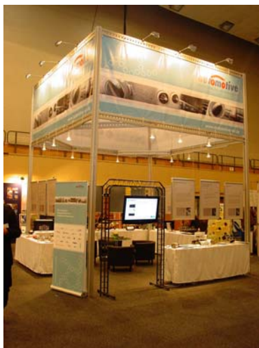
Stand des automotive-mv

Automobilzulieferer aus Mecklenburg-Vorpommern demonstrieren Leistungsfähigkeit