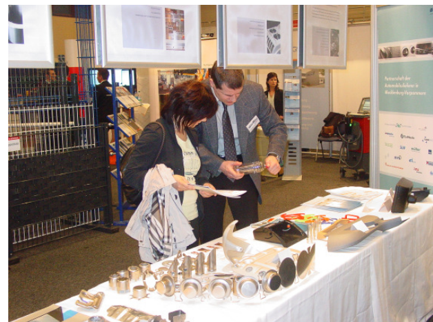
Bild oben: Elf Unternehmen des automotive-mv e. V. präsentierten ihre Exponate und überzeugten die zahlreichen Besucher von der Leistungsfähigkeit der Zulieferer im MV

Bild links: Gemeinschaftsstand des automotive-mv in zentraler Lage in der Rostocker Stadthalle