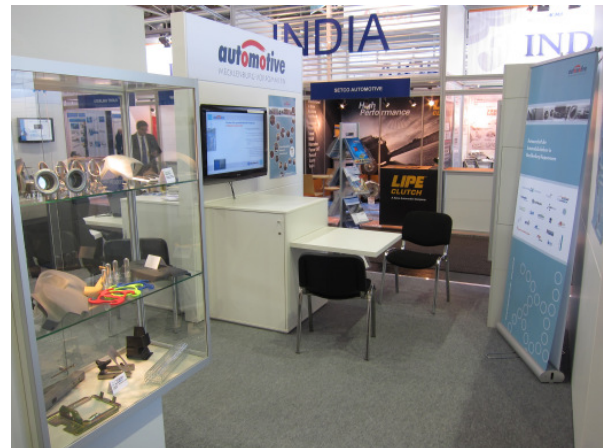
Abb. 4 und 5: Die Präsenz des automotive-mv e. V. auf dem Gemeinschaftsstand des ACOD

Beeindruckende Beispiele für die Technologie der Zulieferer unterschiedlichster Größe aus dem Nordosten waren in den zwei Messewochen zu sehen: hochpräzise Komponentenfertigung für automobiler Hydraulik-, Ventil- und Pumpentechnik von der Hydraulik Nord Fluidtechnik, innovative Metallumformung durch die Lang Metallwarenproduktion, die Fertigung hochmoderner Fahrzeugelektronik, wie z. B. Fahrzeuginformationssysteme durch die ml&s GmbH, die Fertigung automobiler Kunststoffteile durch die Teterower Kunststoffe GmbH