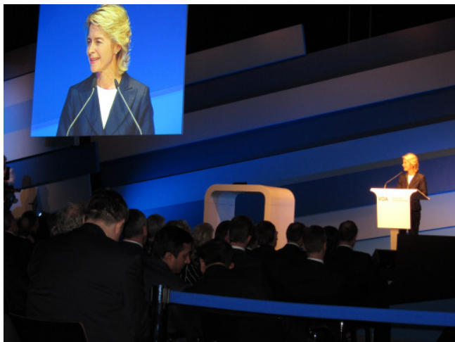
Abb. 1: Bundesministerin Frau von der Leyen bei der Eröffnungsveranstaltung

Der VDA als Veranstalter erwartete 1731 Ausstellern aus 41 Ländern. Damit wird das Ergebnis der IAA 2006 schon übertroffen. Dies ist ein durchaus positives Signal nachdem die Nutzfahrzeugindustrie, auch in Deutschland, ihre schwerste Absatzkrise seit 1945 bewältigen musste und noch immer muss.