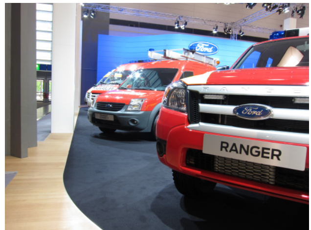
Abb. 2 und 3: Beeindruckende Nutzfahrzeugtechnik der namhaften Hersteller

Auch der automotive-mv e. V. – der Verein der Automobilzulieferer aus Mecklenburg-Vorpommern – demonstrierte die Leistungsfähigkeit der Branche in unserem Land. Mit Unterstützung des Wirtschaftsministerium des Landes Mecklenburg-Vorpommern beteiligen sich acht Unternehmen aus unserem Land und der automotive-mv e. V. am Gemeinschaftsstand der ostdeutschen Automobilzulieferer, organisiert durch den ACOD e. V. und der fünf Länderinitiativen. Die Unternehmen aus dem Nordosten haben sich somit zusammen mit 22 weiteren Ausstellern aus den Neuen Bundesländern in Halle 13 Stand C 28 präsentiert.