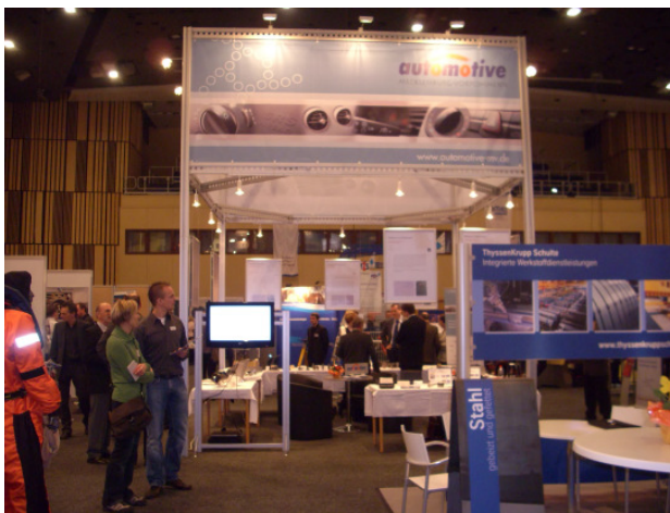
Reges Interesse am Stand des automotive-mv e. V.

Interessante Gesprächsinhalte boten sich allemal – der Wettbewerbsdruck nimmt in der Automobilzulieferindustrie wie in anderen Branchen zu – der Erfahrungsaustausch wird um so wichtiger. Natürlich wurde auch über die aktuelle Wirtschaftskrise gesprochen. Der optimistische Ausblick in die Zukunft stand aber im Vordergrund.