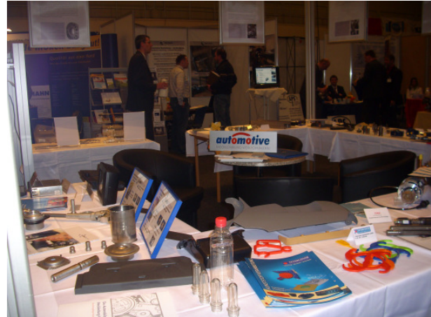
Elf Unternehmen des automotive-mv e. V. waren mit ihren Exponaten auf dem Gemeinschaftsstand präsent