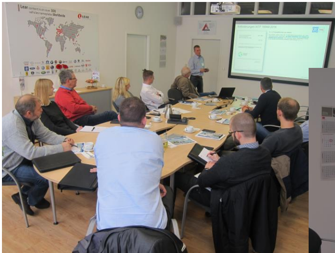
Foto-Impressionen vom Best-Practice-Workshop „Erfolg und Effizienz im Qualitätsmanagement durch den passgenauen Einsatz von Kennzahlensystemen“ bei der Lear Corp. GmbH in Wismar am 09.11.2016