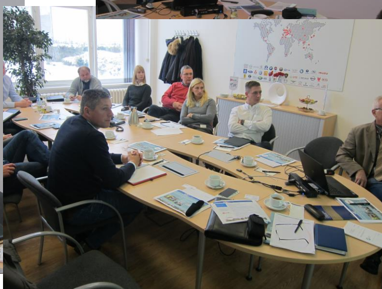
Abb. auf Seite 1:

Bilder oben links und unten rechts: Insgesamt trafen sich 14 Teilnehmer aus verschiedenen Mitgliedsbetrieben des automotive-mv e. V. zum Fachworkshop in Wismar, verfolgten die hochinteressanten Ausführungen zum Thema ‚Kennzahlen im Qualitätsmanagement‘ und nutzten die Gelegenheit für vielen Fragen und regen Erfahrungsaustausch.