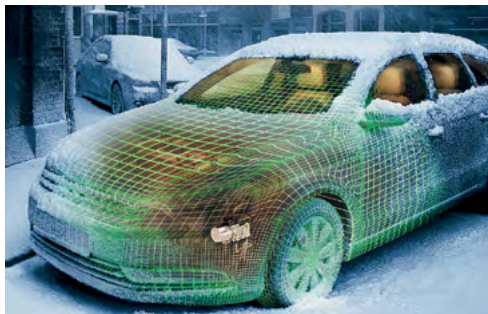
Innovative Heizlösungen von Webasto

Wichtig: Wenn Sie an der Betriebsbesichtigung um 11:00 Uhr teilnehmen wollen, teilen Sie uns dies bitte mit der Anmeldung mit. Dies erleichtert unsere Planung. Danke.