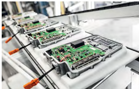
Produktion bei Webasto