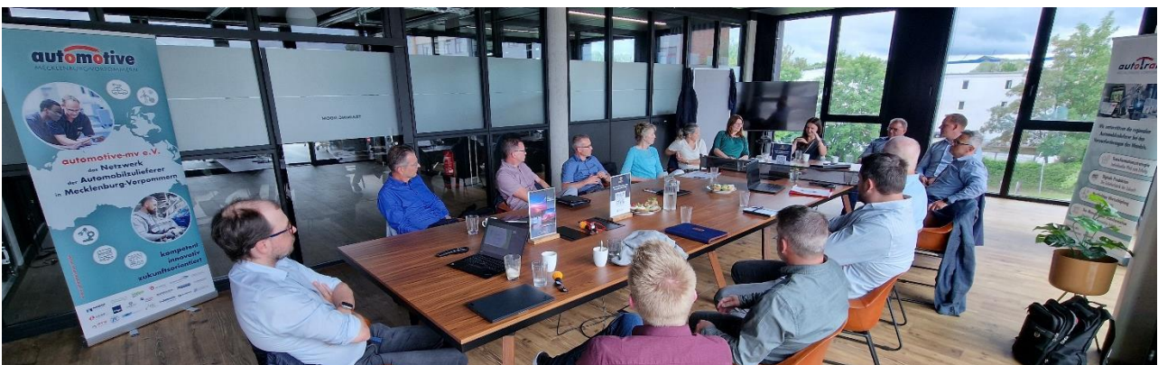
Abb. 1: Teilnehmende aus acht Mitgliedsbetrieben diskutieren im @Work Neptun Kai in Rostock